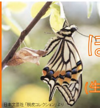
日本文芸社「脱皮コレクション」より